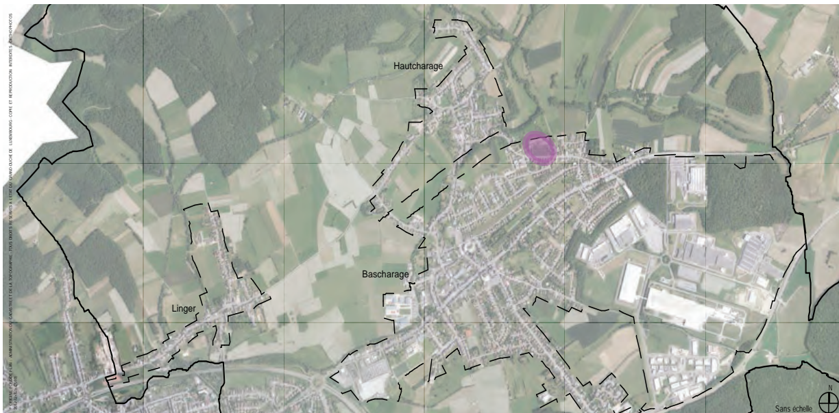
Situation dans la localité de Bascharage