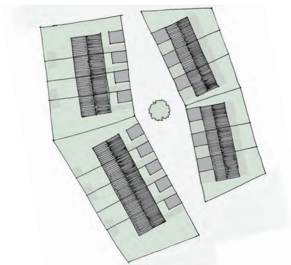
Espace minéral cerné