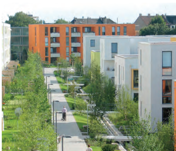
Maillage maisons uni- et plurifamiliales © FörderLandschaftsarchitekten