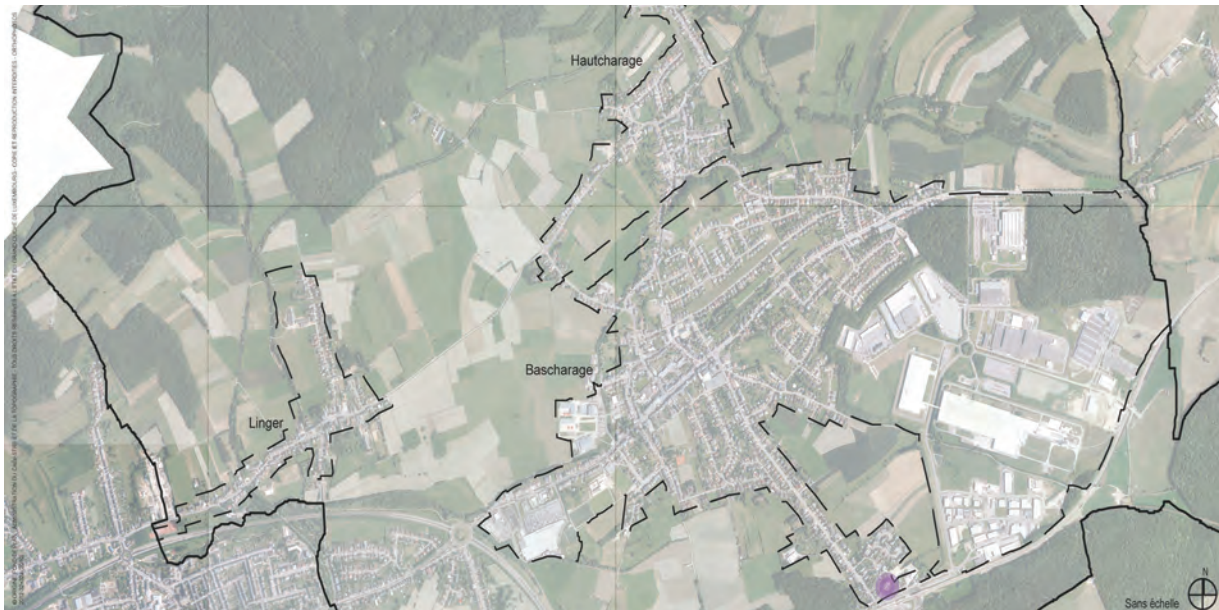
Situation dans la localité de Bascharage