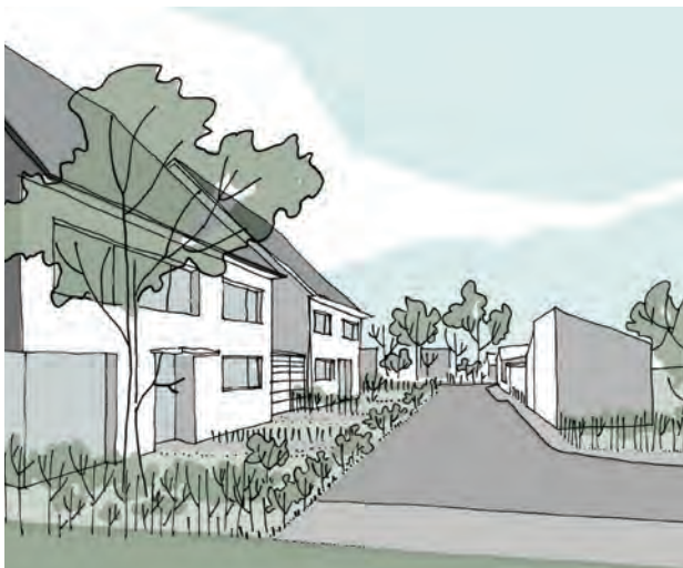
Espace de rencontre