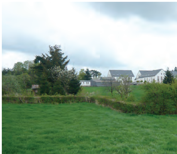
Intégration au paysage © FörderLandschaftsarchitekten